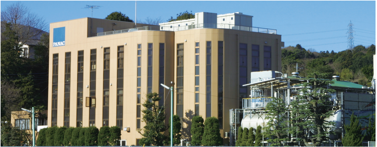
パナック工業株式会社 本社