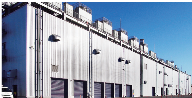
株式会社SUBARU 矢島工場5 ペイント動力棟

排熱回収ヒートポンプ、熱回収ターボ冷凍機により 未利用排熱を活用し大幅な省エネルギーを実現