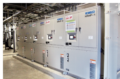
排熱回収ヒートポンプ

(諸元)実測結果に基づく年間シミュレーション比較 一次エネルギー換算値 ※電気(全日)9.76MJ/kWh ※都市ガス45MJ/Nm 3 ※「エネルギーの使用の合理化に関する法律施行規則」