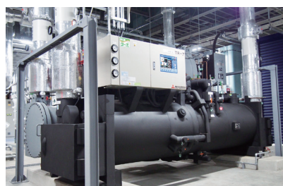
熱回収ターボ冷凍機