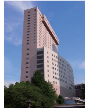
国際ファッションセンタービル 〒130-0015 東京都墨田区横網一丁目6番1号 TEL.03-5610-5801 最寄駅：都営地下鉄大江戸線「両国駅」A1出口に直結 JR中央・総武線「両国駅」東口より徒歩約6分、西口より徒歩約7分