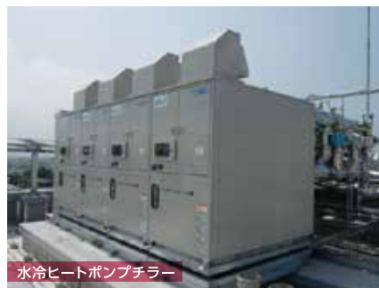
水冷ヒートポンプチラー

西条市は、西日本最高峰である石鎚山の麓に位置し、石鎚山を源とする伏流水(地下水)は、15~30メートルの鉄パイプを打ち込むだけで良質で豊富な水が自然に湧き出てくるため「うちぬき」と呼ばれている。この地下水は、飲用だけでなく、水を活用した産業も育くみ、西条市が「水の都」と呼ばれるゆえんとなっている。また、環境庁(現環境省)の「名水百選」や、国土庁(現国土交通省)の「水の郷」に認定され、1995年と96年には岐阜県で行われた全国利き水大会で2年連続日本一のおいしい水に選ばれるなど高く評価されている。