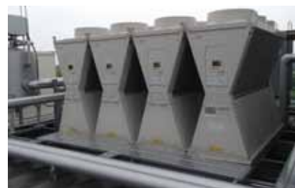
空気熱源ヒートポンプチラー

富士印刷株式会社では、品質・コストサービス・環境改善などを求められる今日、社会とお客様と社内の共生をテーマに活動していくなかで今後も省エネ性や環境性を重視した設備を導入し、地球環境保護に向けた取り組みを進めていく。