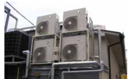
業務用ヒートポンプ給湯機

今後も、さらなる省エネ・省コストを実現するために検討を重ね、環境に配慮したシステムの構築を目指すとともに、シリアルとお菓子で「もっと楽しく、健やかに。」というスローガンのもと、食べる人の笑顔を生み出すことを通じ、社会へ貢献していきたいと考えている。