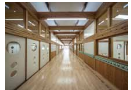
オープンスペース

立山町は、標高3,000m級の立山連峰ふもとに位置し、豊富な地下水と豊かな自然環境を誇る。町では、その環境を守るため積極的に環境負荷の低減を推進し、「低炭素・循環・自然共生」地域創生実現プラン実現事業のモデル地区として、未利用エネルギーの活用、CO 2 排出削減を推進している。