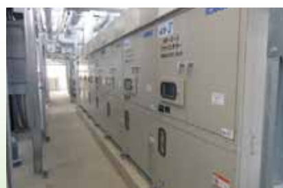
ブラインチャラー

当モールを運営するイオンモール株式会社(本社:千葉県美浜区)では、「人と環境に配慮した」モールづくりを実践し、これからも環境保全や社会貢献活動に積極的に取り組む方針である。