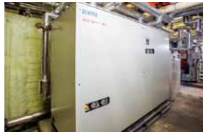
業務用ヒートポンプ給湯機