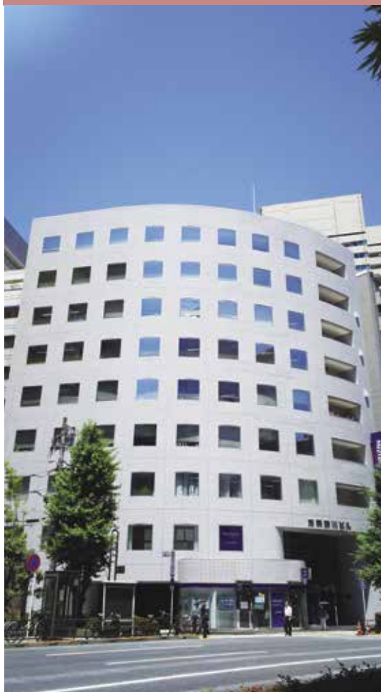
新川ビル(日本で先駆けて氷蓄熱のみで空調システムを構築)