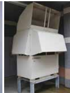
業務用エコキュート