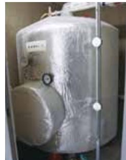
シリンダータンク

一昨年から重油代が高くなり運営に苦慮していたところ、札幌市新エネルギー・省エネルギー機器複合的導入補助事業、中小企業者等向け札幌エネルギーeco プラス事業に、太陽光発電とエコキュートによるシステムで申請し、認定されましたので導入しました。平成24年度1年間のエネルギー・コストで見ると、A重油ボイラーで給湯した場合約260万円かかるところが、業務用エコキュートでは約73万円で賄うことができました、その結果、平成25年度も設備追加を補助金申請して、運営の改善をさらに進められたらと思っています。