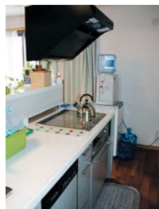
掃除が簡単なIHクッキングヒーター