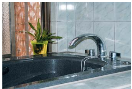
湯切れの心配もいらず快適な水まわり