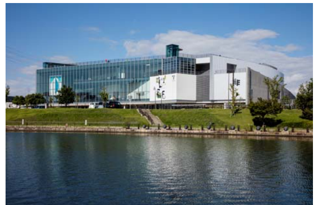
富山県美術館

■一般財団法人ヒートポンプ・蓄熱センター 業務部 業務部 森 (E-mail:mori.yoshiteru@hptcj.or.jp) 遠山 (E-mail:tooyama.hiroshi@hptcj.or.jp) 〒103-0014 東京都中央区日本橋蛸殻町1丁目28番5号 ヒューリック蛸殻町ビル6階 TEL : 03-5643-2402 FAX : 03-5641-4501