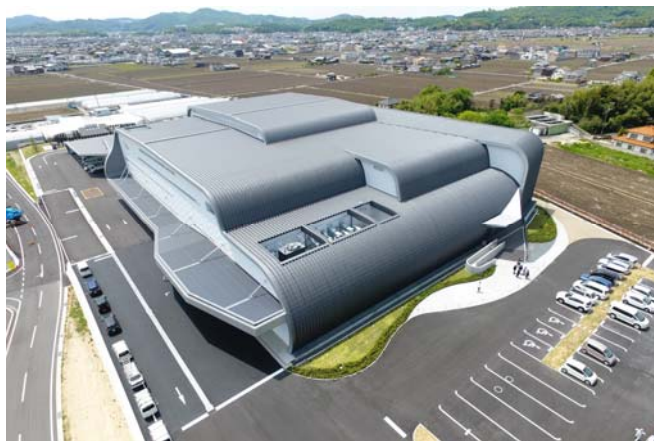
さん太しんぶん館(山陽新聞早島印刷センター)

■一般財団法人ヒートポンプ・蓄熱センター 業務部 森・遠山 〒103-0014 東京都中央区日本橋蛸殻町1丁目28番5号 ヒューリック蛸殻町ビル6階 TEL: 03-5643-2402 FAX: 03-5641-4501