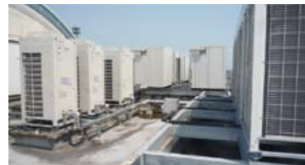
エコ・アイス（個別分散）

今回導入したシステムは既設システムと比べて高効率となっているため、電力使用量や最大電力のさらなる削減に繋がっ