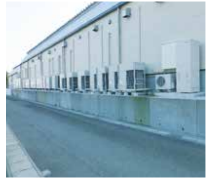
手前：エコキュート 奥：蓄熱式ショーケース室外機

同社は今後も、単に「売上高を増やす」ということではなく、出店する一店舗一店舗が地域の皆さまの暮らしをより豊かに、より快適に、より便利に守り育てることを目的に店舗運営を続けていく。