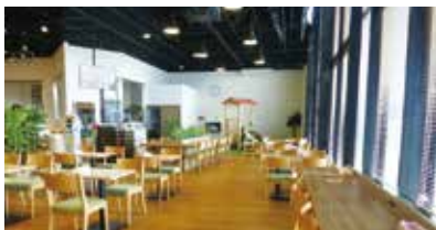
イトインスペース

新店舗の住吉店は買い物だけでなく、来店してもらえるような「地域のコミュニティの場」、「くつろぎの場」となる店を目指している。そのためイトインス