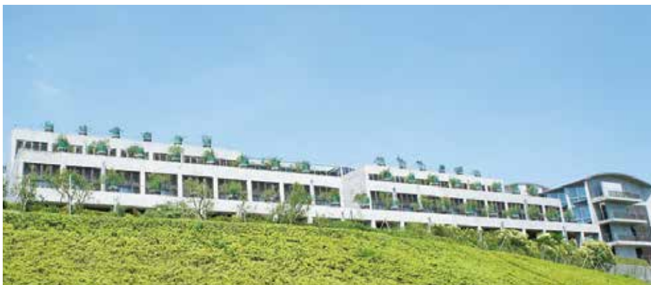
資生堂湘南研修所

継続的なヒートポンプ・蓄熱システムの普及拡大と運転適正化により、電力負荷平準化に大きく貢献