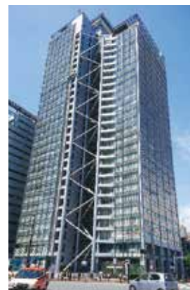
中野坂上サンブライトツイン