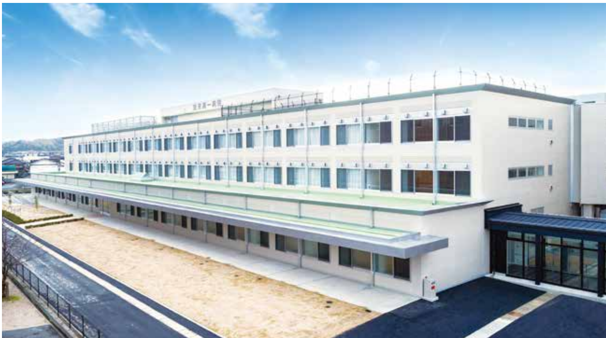
安来第一病院 東館