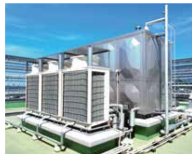
業務用エコキュートと貯湯槽

地域社会に貢献できる人材の育成に取り組むことにより、医療・福祉サービスの提供を通して地域社会に貢献するとともに、省エネルギー性能に優れた高効率設備の導入による、低炭素社会の実現に向けて取り組んでいく。