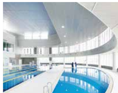
屋内プール