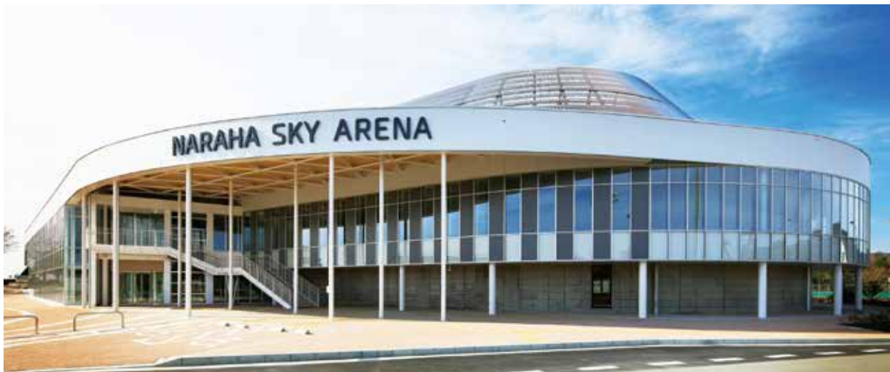
ならはスカイアリーナ

地中熱ヒートポンプなどを利用したプールの保温や床暖房、空調の導入により、省エネルギーを実現