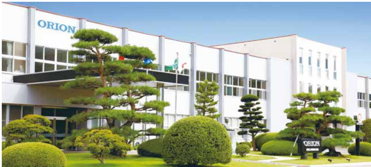
オリオン機械株式会社

ヒートポンプを応用し、ヒータレスを実現した精密空調機を製品化、省エネルギー・CO 2 排出削減に大きく貢献