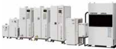
ヒータレスを実現した精密空調機