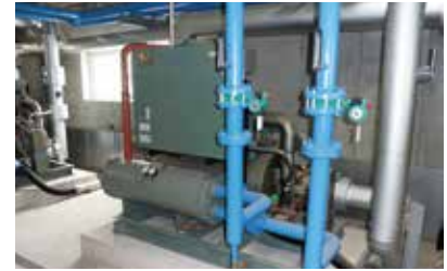
ブラインターボ冷凍機

温度を下げる目的は、コンクリートの流動性など施工性を維持し、打設継ぎ目の不良防止を図るためと、セメントと水が融合する際に発生する水和熱を抑えるためであり、水和熱はコンクリートの耐久性低下に起因するひび割れの原因になるため、水和熱をできる限り抑えて硬化反応させることで品質向上