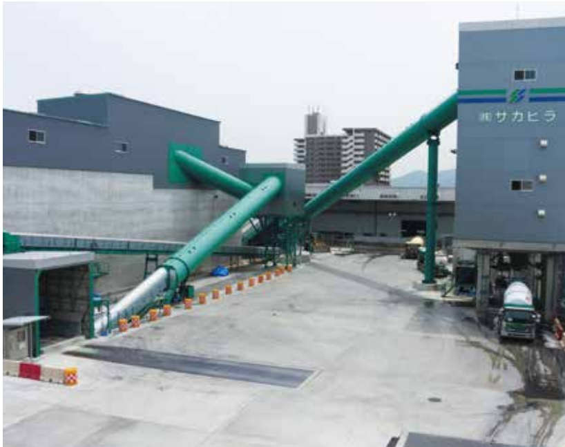
株式会社サカヒラ 箱崎工場

蓄熱システムの導入と有効活用により、 ピーク電力の大幅な削減と省エネルギーを実現