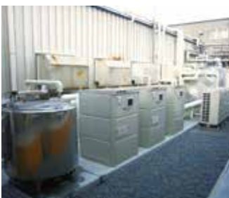
水熱源エコキュート

[諸元] 同一負荷条件による年間シミュレーション比較 一次エネルギー換算値 ※電気(全日)9.76MJ/kWh ※都市ガス45MJ/Nm 3 ※「エネルギーの使用の合理化に関する法律施行規則」