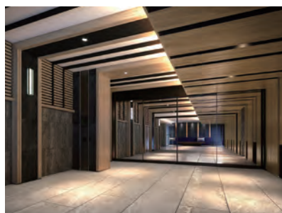
グランクレア榎木町 エントランスホール

また、地下鉄桜通線「桜山」駅から徒歩10分、名古屋駅まで直通で17分の好アクセス地の「グランクレア桜山」は、2022年11月に竣工する。同マンションはオール電化であり、標準採用しているエコキュートは、非常時には、エコキュートのタンク内の水やお湯を非常用水として使用することが可能で、お客さまからは万が一の時に安心できるとの声をいただいている。また、各住戸に防災備蓄倉庫を備え付けて