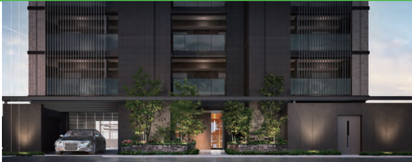
グランクレア桜山 エントランス