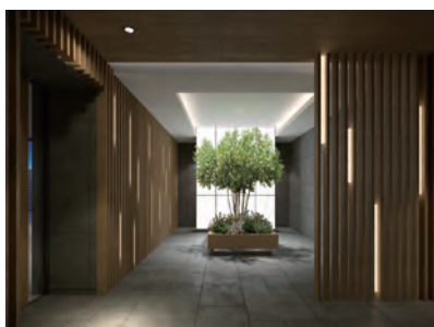
グランクレア桜山スペースラウンジ

名古屋市の中心地、栄にある「Hisaya-odori Park」まで徒歩7分、百貨店や