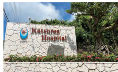
医療法人南嶺会 勝連病院 入口

敷地内の新築計画にともない、本館施設で使用している既存の重油ボイラ(A重油)を撤去する予定があり、新しい給湯設備としてエコキュートを