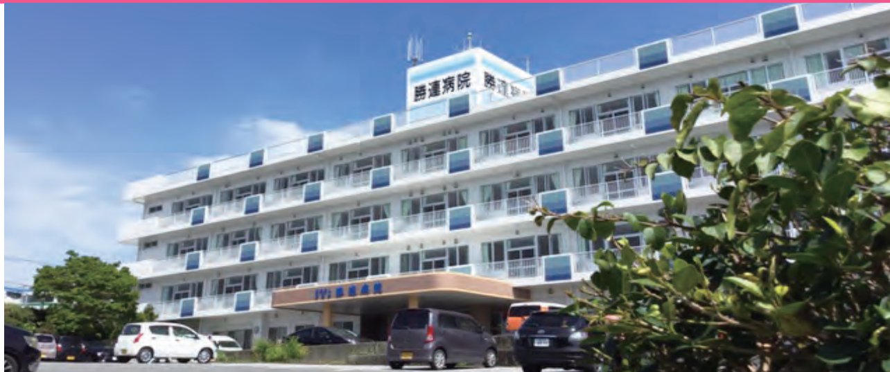
医療法人南嶺会 勝連病院