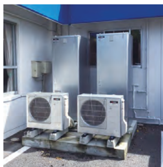
業務用エコキュート