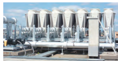
空冷式ヒートポンプチラー

設備更新前と比較して、一次エネルギー消費量で▲3,742GJ(▲46%)削減、CO 2 排出量で▲222t-CO 2 (▲59%)削減を実現。同社は今後も省エネルギー・省CO 2 に貢献することで、地域社会に親しまれるショッピングセンターの運営を目指していく。