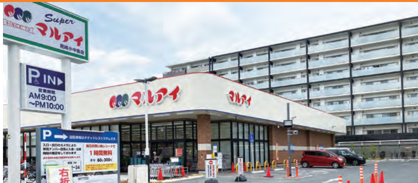
マルアイ尼崎小中島店