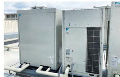
エコ・アイス(個別分散)

とした「マルアイ尼崎小中島店」を出店(2021年4月オープン)。兵庫県は条例で1,000㎡以上の建築物には緑化が義務付けられていることもあり、環境配慮型の店舗づくりの一環として屋根全面に屋上緑化システムを導入している。