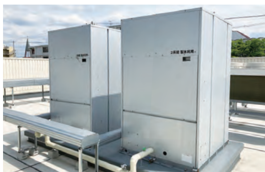
蓄熱式ショーケース