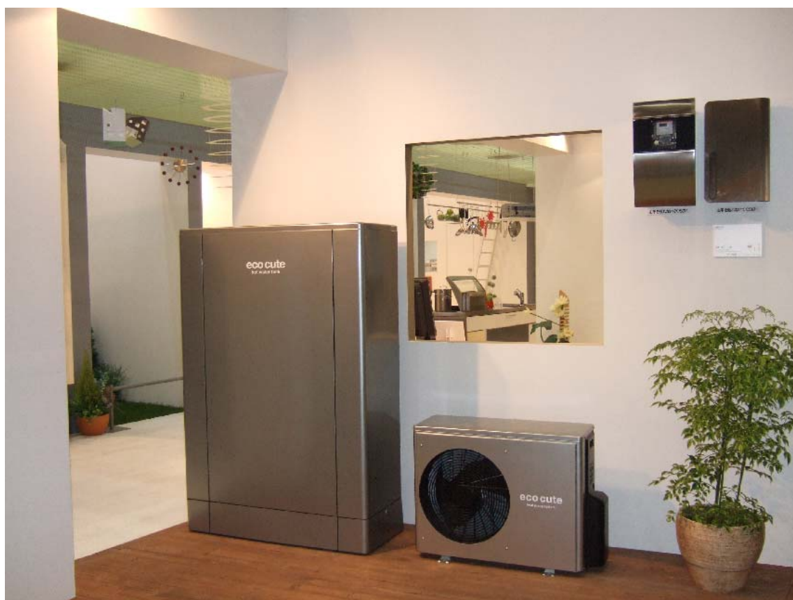
自然冷媒ヒートポンプ給湯機“エコキュート”