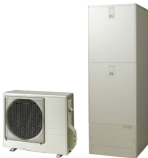
ヒートポンプユニット

大気中の熱を熱交換器で CO2 冷媒に集め、その冷媒を圧縮機でさらに高温にして、お湯を沸かす仕組みです。大気中の熱を上手に活用するため、投入した電気エネルギーの 3 倍以上の熱エネルギーを得ることができ、高い省エネルギー性を実現しています。